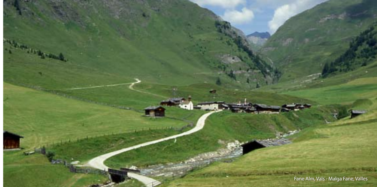
Fane Alm, Vals - Malga Fane, Valles

Gironzolare per Rio di Pusteria, tuffarsi nel medioevo al castello di Rodengo, fare shopping nel centro storico di Bressanone, un'escursione al paesino di malghe „Malga Fane“ o visitare i giardini botanici del castello „Trauttmansdorff“ a Merano... le vostre vacanze diventeranno un'esperienza indimenticabile.