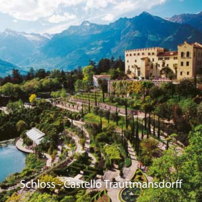
Schloss - Castello Trauttmansdorff