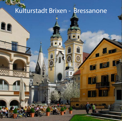
Kulturstadt Brixen - Bressanone