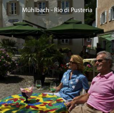
Mühlbach - Rio di Pusteria