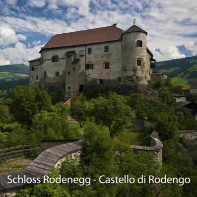
Schloss Rodenegg - Castello di Rodengo